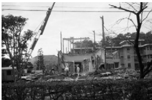
写真12 ほぼ解体された旧館