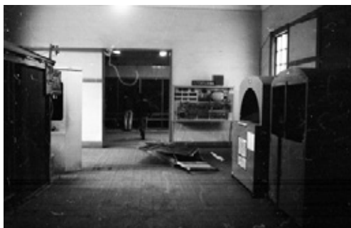
写真7 片付けを始めた旧館理工展示室