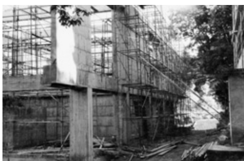
写真22 コンクリート打込み施工中 (屋外トイレ付近)