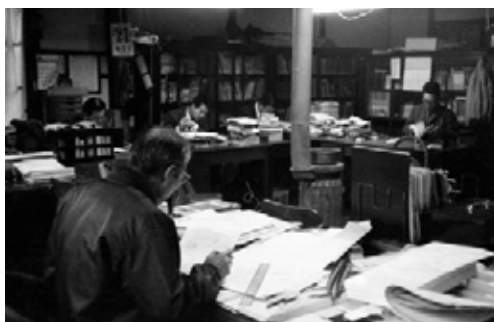
写真5 旧館の事務室で執務する職員