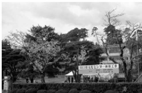
写真15 起工式会場の外観