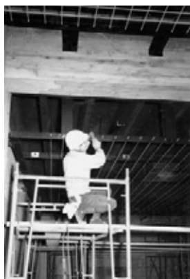
写真29 ワイヤ天井施工中