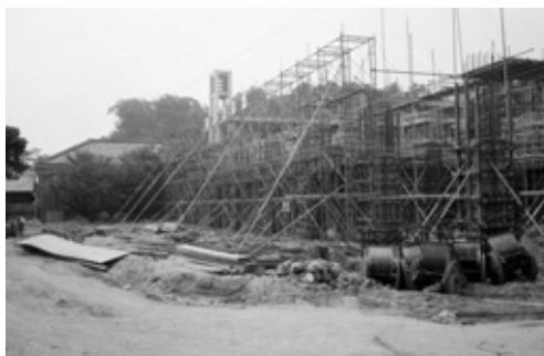
写真20 鉄筋組み施工中