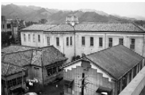
写真4 南側から撮影した旧館