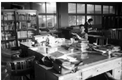
写真6 事務室を理科教育センターに移転