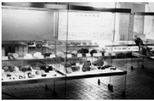
写真41 展示が完了した地学展示室