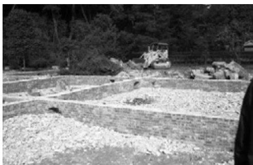
写真14 基礎を解体し土地造成を開始