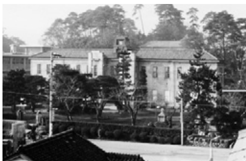
写真1 1965（昭和40）年頃の旧館外観

当館は2012（平成24）年に開館100周年を迎え、3月27日に記念式典を挙行し、7月13日付けで開館100周年記念誌『山口博物館100年のあゆみ』（以下「本編」）を発行した。本編には多数の写真を掲載したが、編集の段階ではさらに多くの写真を収集しており、掲載できなかったもののほうが多い。本稿ではこれら掲載できなかった写真の中から、旧館（1917（大正6）年完成）の解体から新館（現在の建物）の完成に至る工事関係の写真を選び、編集した。あわせて、日時順に流れを追っていけるよう、館務日誌の抜粋を中心に、工事関係の記事を表にして掲載した。期間は、工事のため休館した日（1966（昭和41）年1月15日）から、新館の開館日（1967（昭和42）年10月1日）までとした。なお、実際には工事関係の写真は、数百枚に及ぶ。新館の建設については、本編の30～31ページに記述してあるが、本稿はこれを補足するものである。