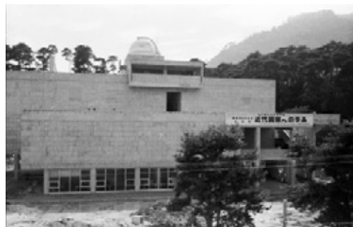
写真33 建築工事はほぼ完了 「近代国家への歩み」の看板も設置