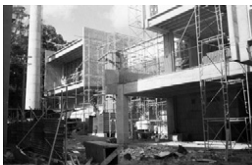
写真25 2階バルコニー等施工中