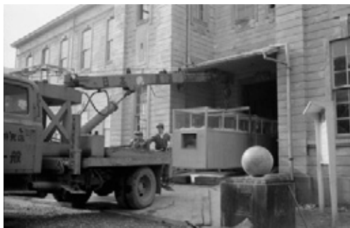
写真9 旧館から運び出される秋吉台のジオラマ