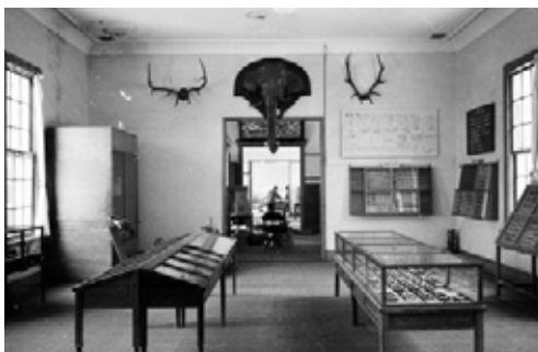
写真8 片付けを始めた旧館生物展示室