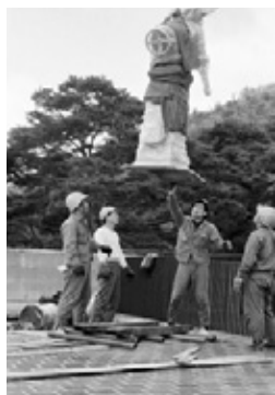
写真34 天体望遠鏡を吊り上げ屋上に運搬