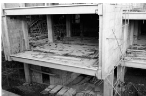
写真24 2階床組み施工中