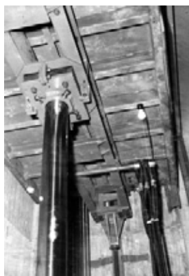
写真30 リフトカゴ・ プランジャー施工中