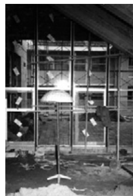
写真31 図書室照明試作中