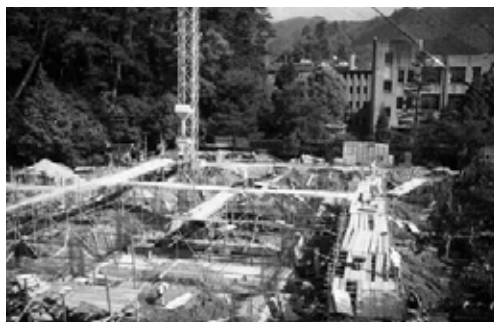
写真19 基礎工事施工中