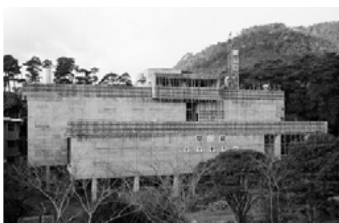
写真26 全体の外観が見えてきた様子