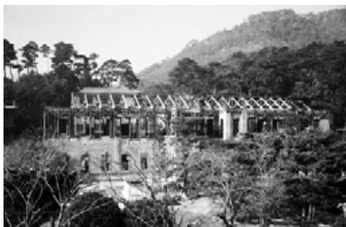
写真11 解体が進んだ旧館