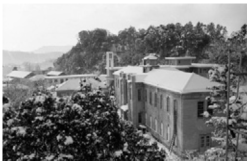
写真3 雪景色の旧館