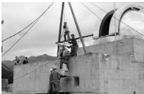
写真35 天体望遠鏡の設置施工中 (ドームへ搬入)