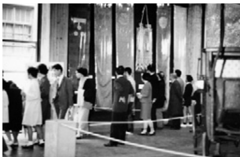
写真40 盛況の「近代国家への歩み」展