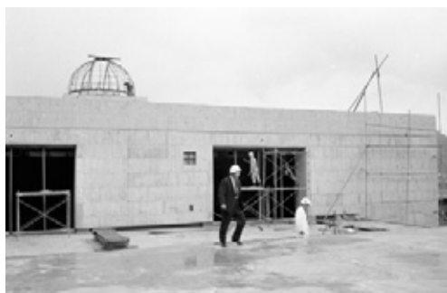
写真27 天体ドーム・屋上施工中