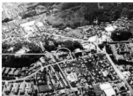
写真2 解体前の旧館周辺