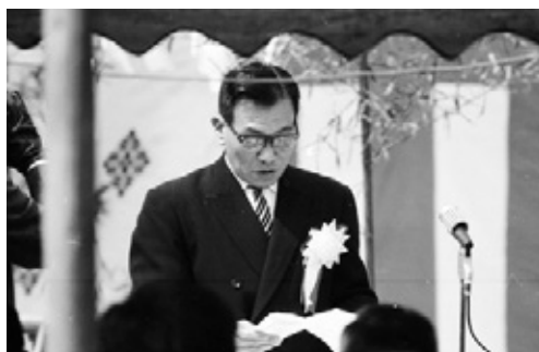
写真17 式辞を述べる橋本正之知事