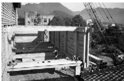
写真23 2階天井組み施工中