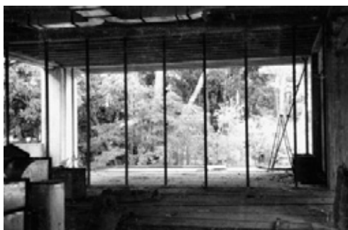
写真28 サッシュ取り付け施工中