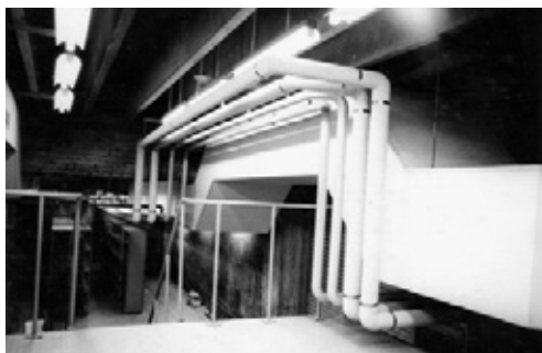
写真39 1階資料室竣工