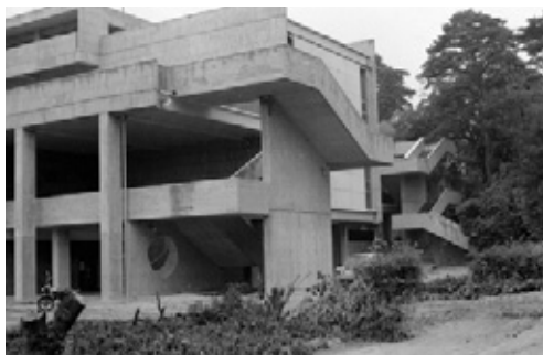
写真32 外階段仕上がり状態 現在は改修されている