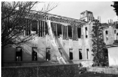
写真10 旧館の解体が始まった様子 手前右の建物は1941(昭和16)年完成の赤道儀室