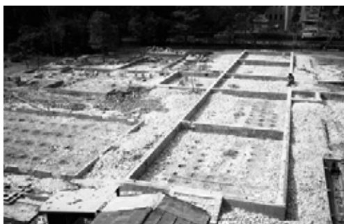
写真13 旧館が解体されほぼ基礎だけとなった状態