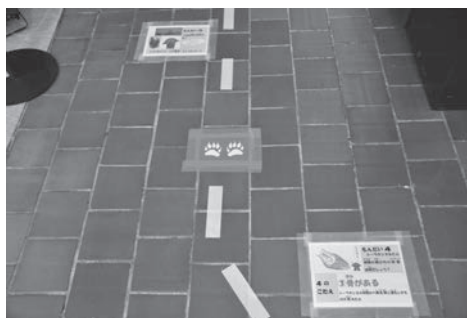
写真1 誘導とクイズの様子

新型コロナウイルス感染症対策の一つとして「3密（密閉空間・密集場所・密接場面）」を避けることが政府や県などより求められた。手指の消毒や検温などの他に、ソーシャルディスタンスの確保が求められた。展示室面積から3階の特別展会場に同時に滞在できる人数をおおよそ120名と算定して、入館者の人数制限を実施することとなった。初めは整理券方式で入館者数をコントロールすることを検討したが、整理券配布時に列をなし混雑すること、夏の暑い時期に外で列をつくることは熱中症などの健康面に不安があること、健康チェックの記入などによりスムーズに入館できないことなどが懸念された。検討を重ねた結果、オンライン予約を基本とし、健康チェックなどはオンライン予約時に済ませ、予約時間にスムーズに入館できるようにした。特別展での入館者は、予約者だけに限定せず、予約