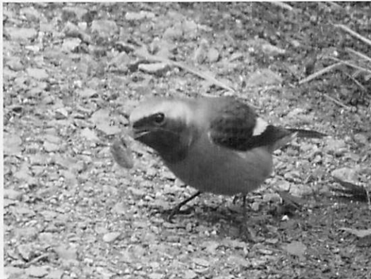
図7 ジョウビタキ (ツグミ科：冬鳥) ・捕まえた昆虫を何回か地面にたたきつけて食べやすくしているようでした。