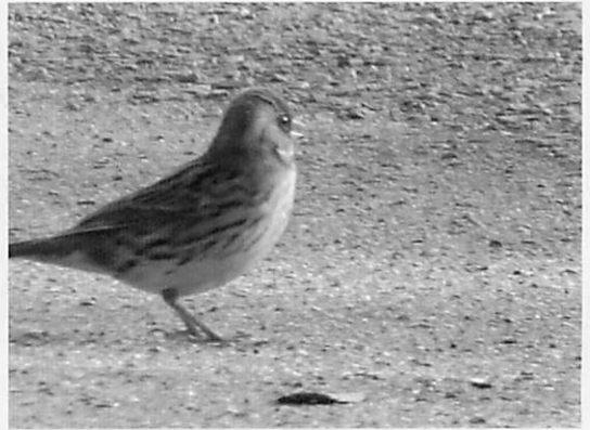
図18 アオジ (2013.12.7) (ホオジロ科：留鳥または漂鳥)