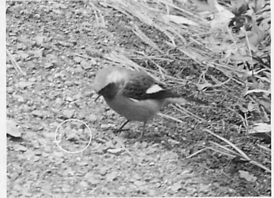
図8 ジョウビタキ (図7、8とも2013.12.5)