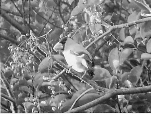
図5 イカル (2013.12.4) (アトリ科：留鳥、果実を食べています)