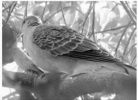
図24 キジバト (2014.1.14) (ハト科：留鳥または漂鳥)