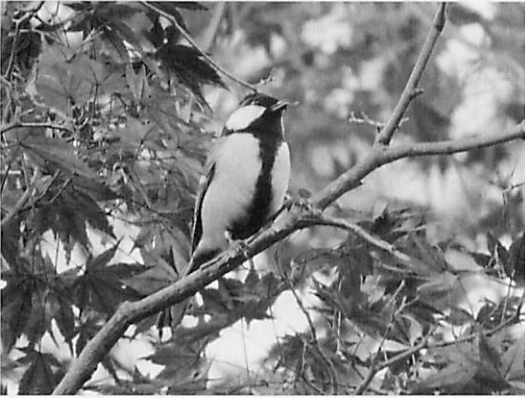
図15 シジュウカラ (2013.11.24) (シジュウカラ科：留鳥または漂鳥)