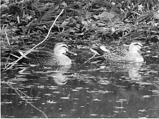
図21 カルガモ (2013.11.29) (カモ科：留鳥または冬鳥) ・博物館南側の小さな池に飛来していました。