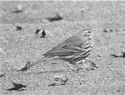
図17 ビンズイ (2013.12.5) (セキレイ科：留鳥または夏鳥)