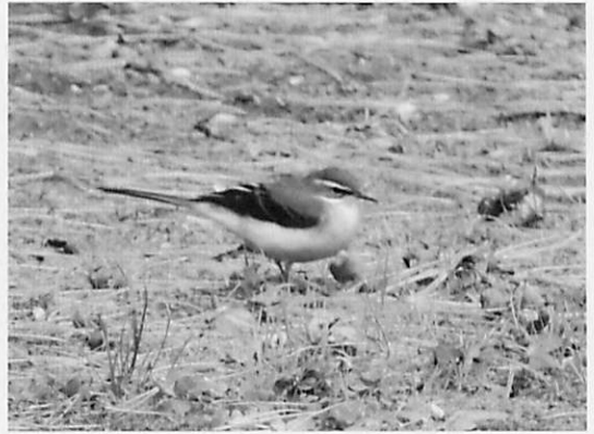
図16 キセキレイ (2013.12.5) (セキレイ科：漂鳥または留鳥)