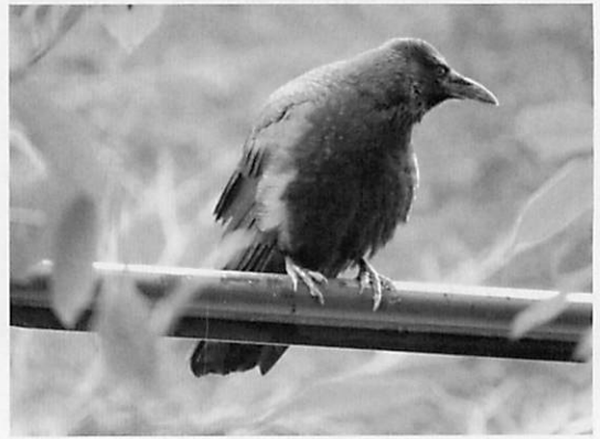
図20 ハシボソガラス (2013.12.18) (カラス科：留鳥または旅鳥)