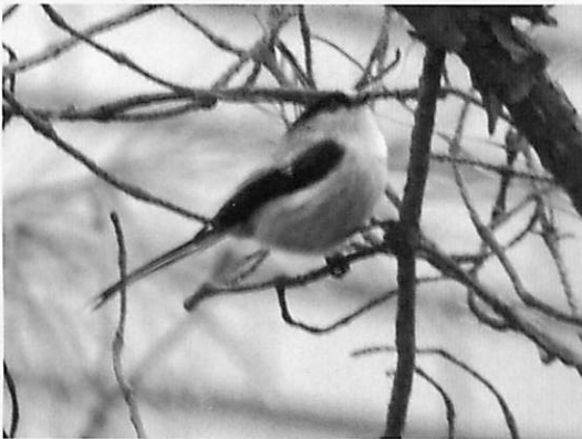
図13 エナガ (2013.11.24) (エナガ科：留鳥または漂鳥)

博物館周辺の野鳥の観察を始めた初秋頃は、目の前に野鳥がいても気づかずに、逃げられてしまうことがほとんどでしたが、次第に野鳥の気配を感じるようになりました。しかし、逆に2013年4月から博物館に研修にきていながら、それまでいかに周りを「見ているようで見えていなかった」のかを実感することになりました。まだまだ見逃した野鳥も多いと思いますが、少し意識しただけでもこれだけの種類の野鳥が「見えて」きました。