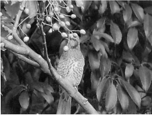
図11 ヒヨドリ (2013.12.5) (ヒヨドリ科：留鳥または漂鳥)