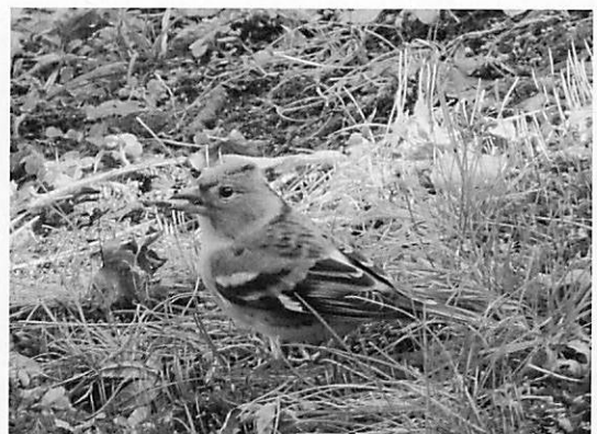
図4 アトリ (2013.12.25) (アトリ科: 冬鳥、果実を食べています)