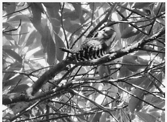
図26 コゲラ (2014.1.23) (キツキ科：留鳥) ・カラ類に混じり小枝をつついていました。