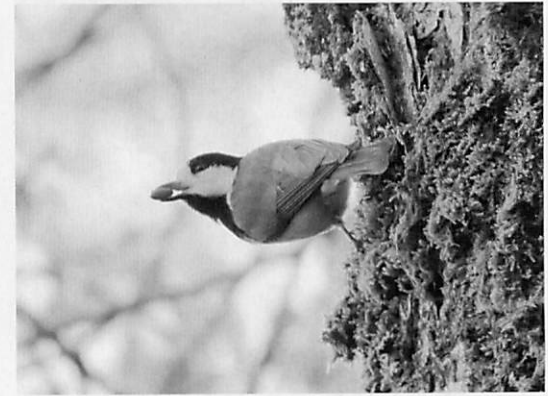
図10 ヤマガラ (図9、10とも2013.12.7)