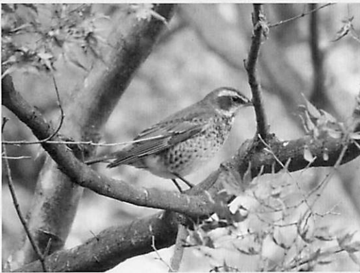
図19 ツグミ (2013.12.5) (ツグミ科：冬鳥)