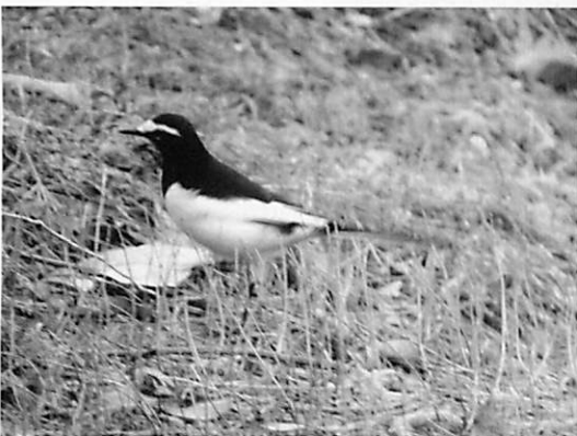
図25 セグロセキレイ (2014.1.16) (セキレイ科：留鳥) ・ハクセキレイはよく見かけますが…。