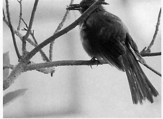
図12 ヒヨドリ (※2013.9.15)