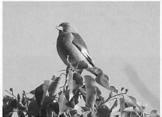
図14 カワラヒワ (2013.12.7) (アトリ科：留鳥(漂鳥)または冬鳥)