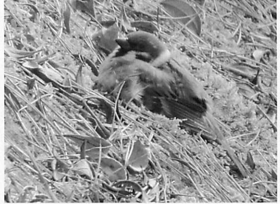
図22 スズメ (2014.1.7) (ハタオリドリ科：留鳥または漂鳥) ・博物館前の小川の土手にて