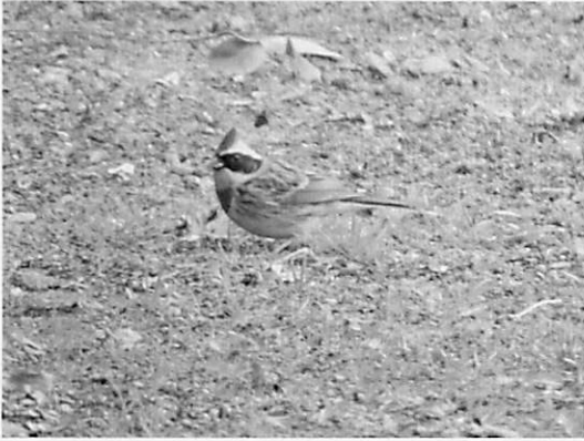
図27 ミヤマホオジロ (2014.128) (ホオジロ科：冬鳥) ・メスと一緒に仲良くエサをついばんでいました。 黄色と黒の頭で、冠羽があります。