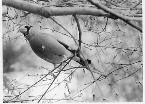
図6 イカル (2014.1.15) (アトリ科：留鳥、果実を食べています)