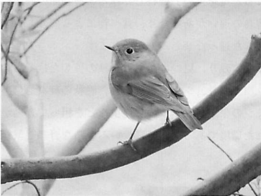
図23 ルリビタキ (2014.1.9) (ツグミ科：留鳥 (漂鳥))