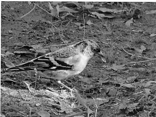
図3 アトリ (2013.12.15) (アトリ科: 冬鳥、果実を食べています)

図の3~12は、食餌中の野鳥の姿です。よく見ると、くちばしの先に食べ物をくわえています(図8は口から離しています)。野鳥は、大きく分けて果実食と、昆虫食に分けられます。ヒヨドリは雑食なのでどちらの姿も撮影することができました。