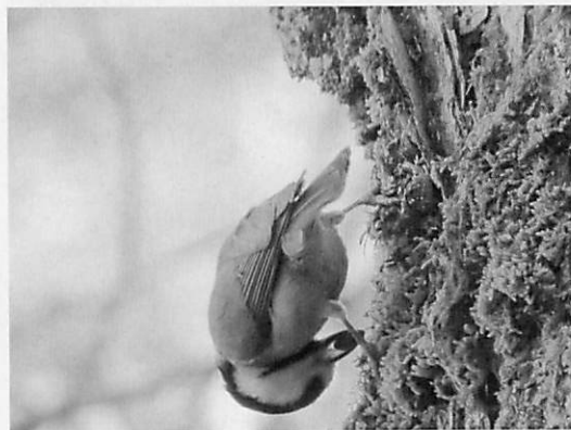
図9 ヤマガラ (シジュウカラ科：留鳥または漂鳥) ・木をつつく音がしたのでコゲラかと思いましたが、ヤマガラが木の実を割っていたようです。