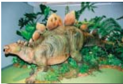
ステゴサウルス生態模型