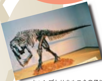
キャンプトサウルス全身骨格標本