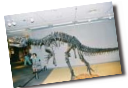
アロサウルス全身骨格標本