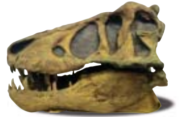
ティラノサウルス頭骨骨格標本