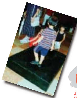
恐竜の足跡くらべ