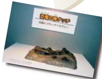
さわれる骨の化石

アメリカで発掘された恐竜化石を中心に、恐竜が出現する前の時代、恐竜の栄えた時代、そして恐竜の絶滅した後の時代を様々な化石を使って紹介します。全長6mのキャンプトサウルスなどの全身骨格や、動くトリケラトプスの復元模型などの展示をはじめ、CG映像の上映、さらには、本物の恐竜の骨に触ることもできます。